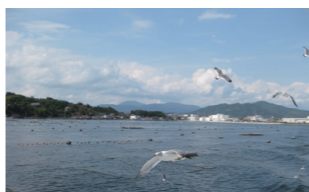
アジア太平洋資料センター (PARC)

26日 ⊕ 17:15～17:50 27日 ⊕ 13:55～14:30 28日 ⊕ 10:00～10:35 30日 ⊕ 14:45～15:20 2日 ⊕ 15:10～15:45