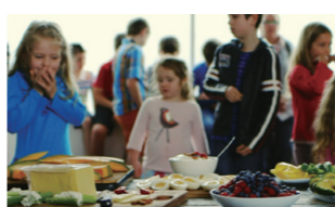
©2014 Madman Production Company Pty Ltd. Old Mates Productions Pty Ltd. Screen Australia ALL RIGHTS RESERVED

26日 ⊕ 19:00～20:42 29日 ⊕ 12:50～14:32 1日 ⊕ 10:00～11:42