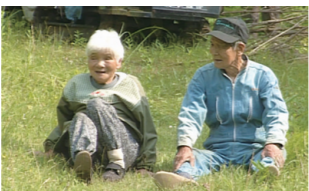
制作著作：山口放送

26日 ⊕ 14:00～15:27 28日 ⊕ 19:30～20:57 29日 ⊕ 10:00～11:27 30日 ⊕ 11:10～12:37 1日 ⊕ 15:30～16:57 2日 ⊕ 17:00～18:27