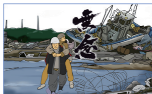
製作：浪江まち物語つたえ隊、まち物語制作委員会

26日 ⊕ 17:50～18:44 27日 ⊕ 14:30～15:24 28日 ⊕ 10:35～11:29 30日 ⊕ 15:20～16:14 2日 ⊕ 15:45～16:39